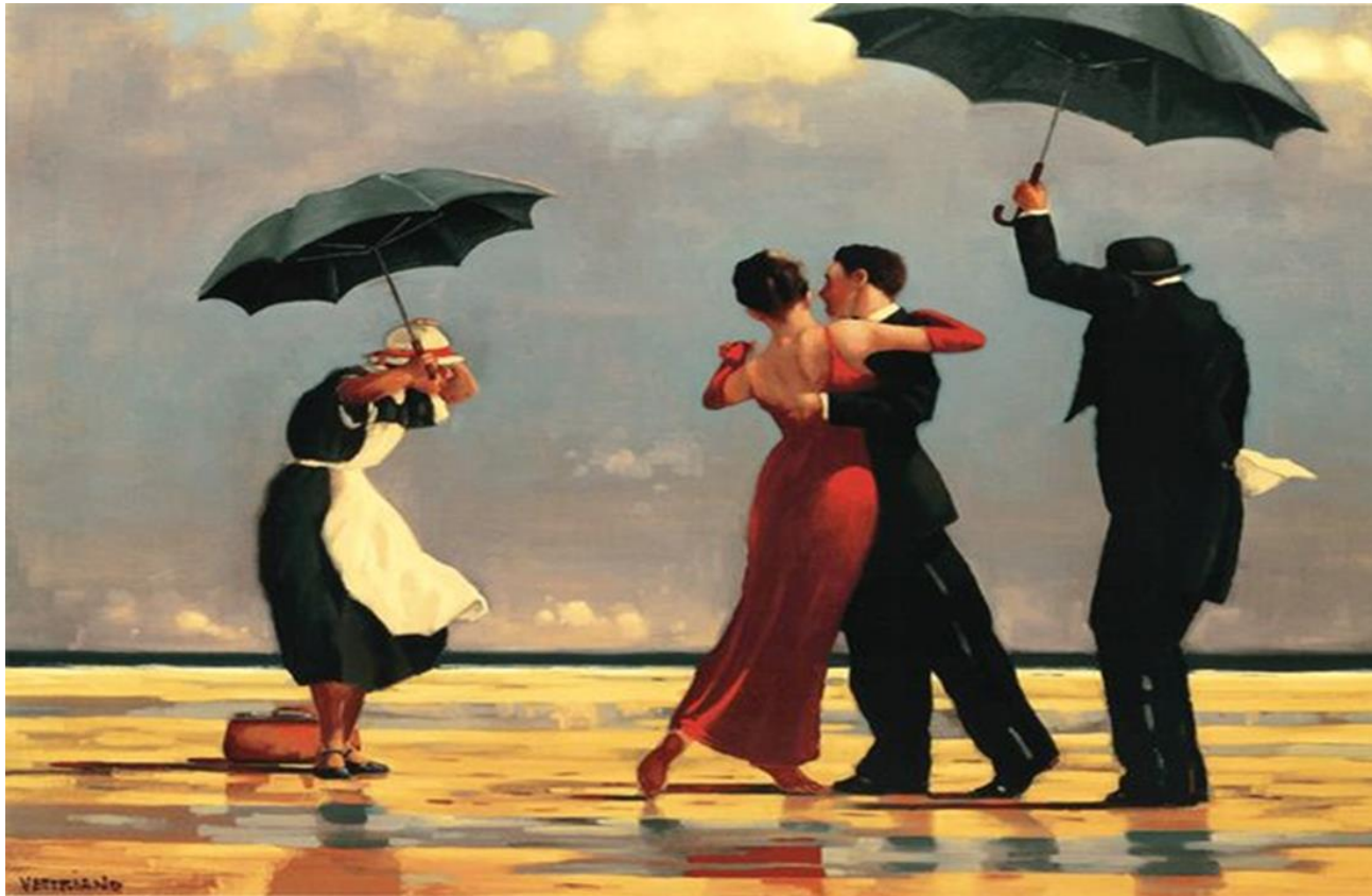
The singing butler (1992) Jack Vettriano